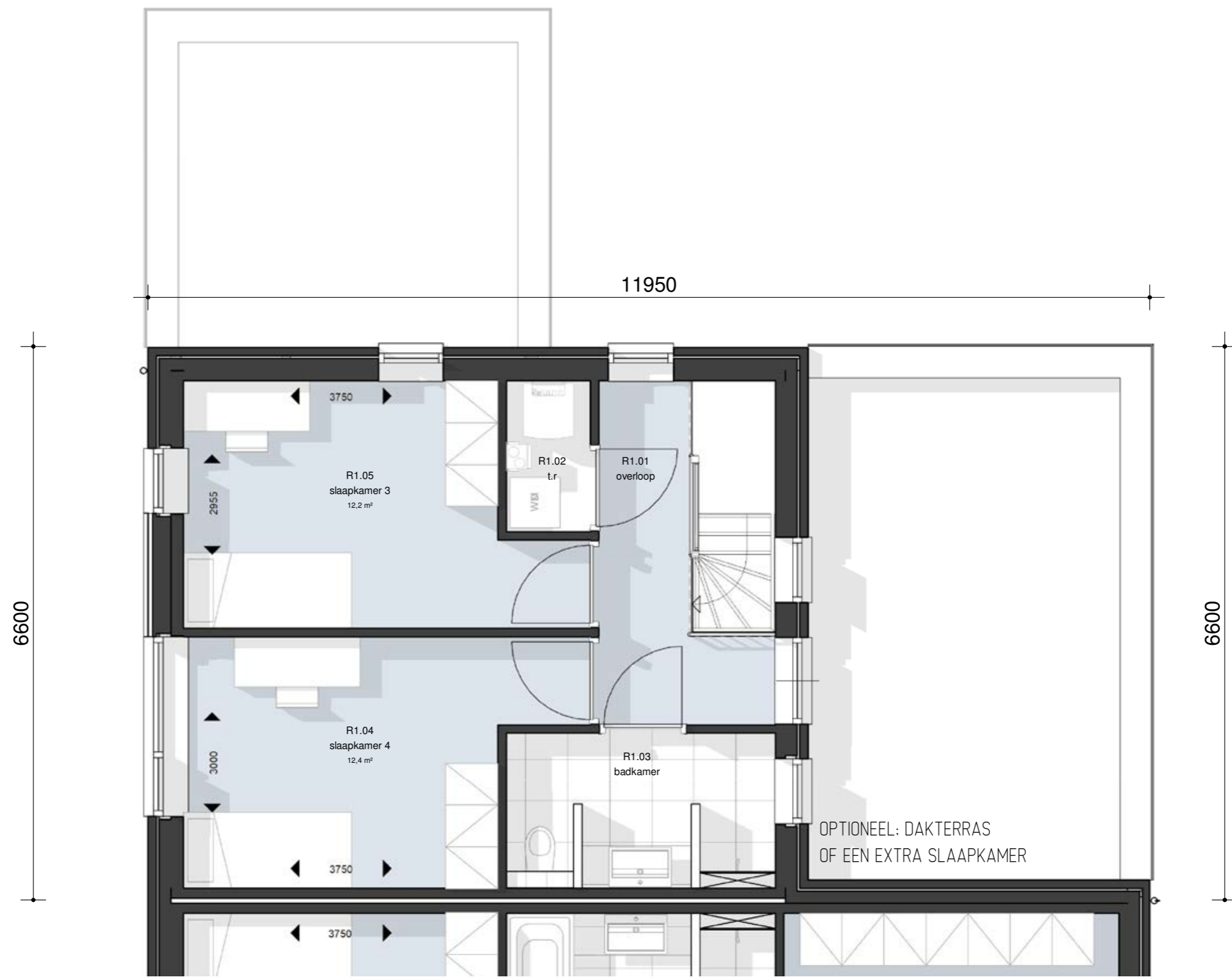
I E VERDIEPING SCHAAL 1 : 50